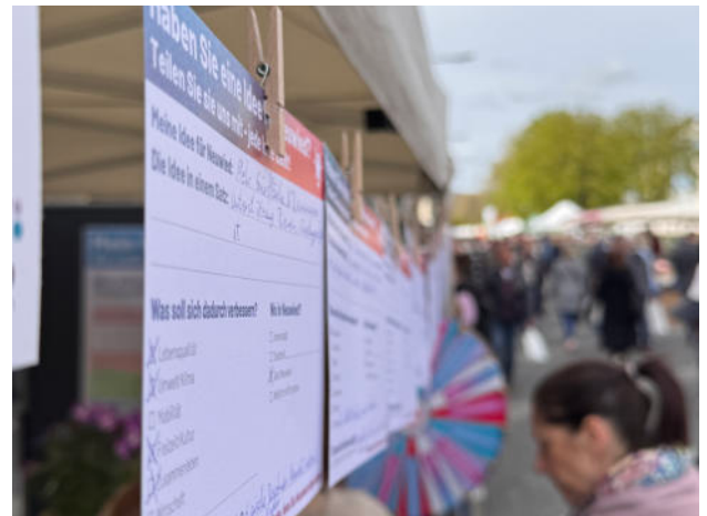
Abb. 2: Steckbriefe mit Ideen der Bürger:innen an der Zukunftsleine