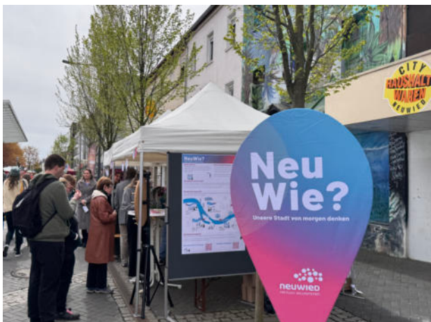
Abb. 3: Der Stand auf dem Gartenmarkt lädt Besucher:innen ein, ins Gespräch zu kommen und ihre Anregungen abzugeben