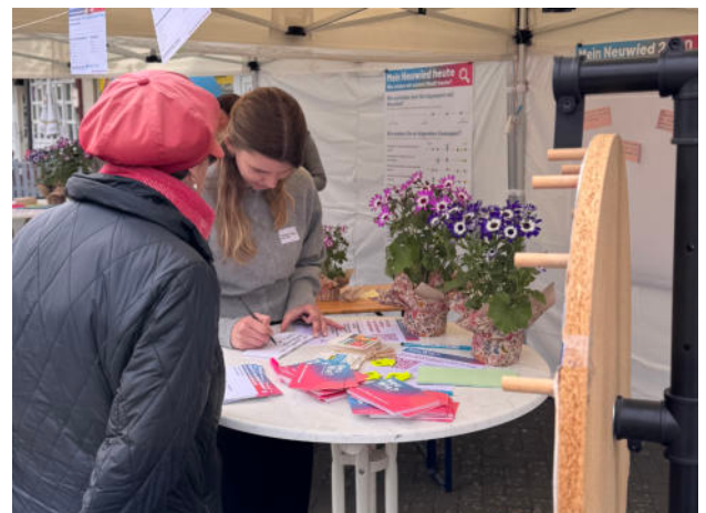
Abb. 4: Ideen und Anregungen der Bürger:innen zu den Themeninseln werden aufgenommen