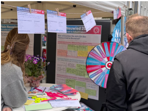
Abb. 1: Bürger:innen drehen am Zukunftsrad

Insgesamt ermöglichte das Format einen direkten Zugang zu einem breiten Spektrum an Perspektiven und trug dazu bei, auch spontane Stimmen und alltagsnahe Einschätzungen in den Beteiligungsprozess einzubinden.