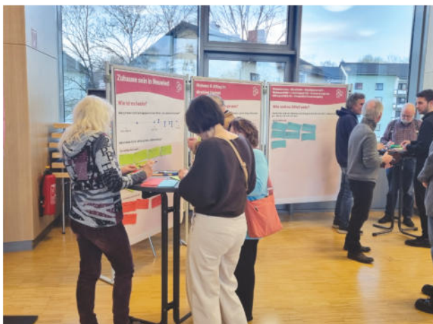
Abb. 5: Bearbeitung an der Themeninsel "Zuhause sein in Neuwied"