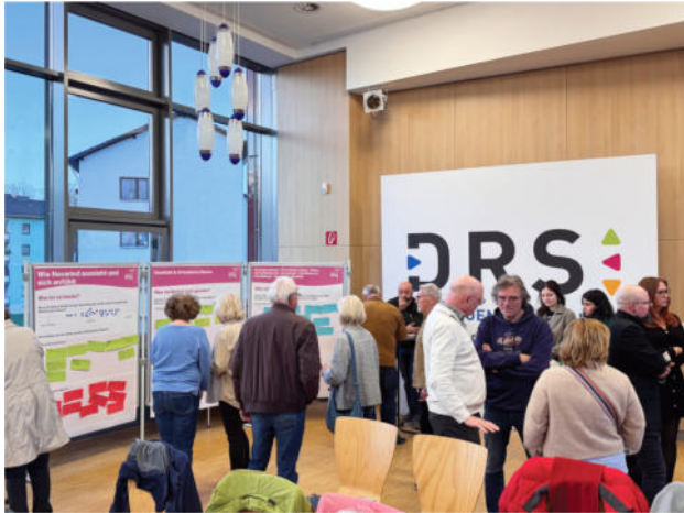
Abb. 1: Aktive Phase an den sechs Themeninseln