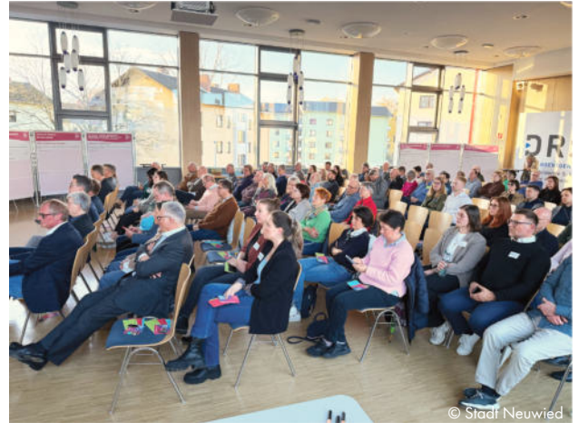
Abb. 2: Die Teilnehmenden kommen im Plenum zusammen