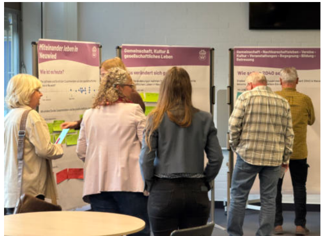
Abb. 4: Bearbeitung an der Themeninsel "Miteinander leben in Neuwied"