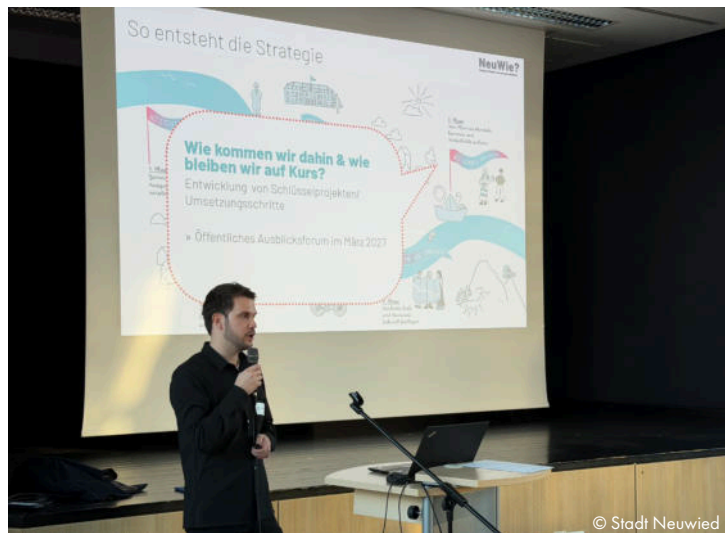
Abb. 7: Erläuterung des Beteiligungsprozesses

Im Folgenden wird eine zusammenfassende Auswertung dieser Umfrage dargestellt.